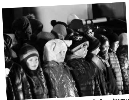
Vystoupení při rozsvícení vánočního stromu