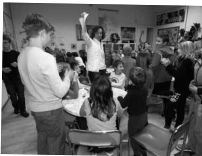
Vranovská kachna - přespání ve škole