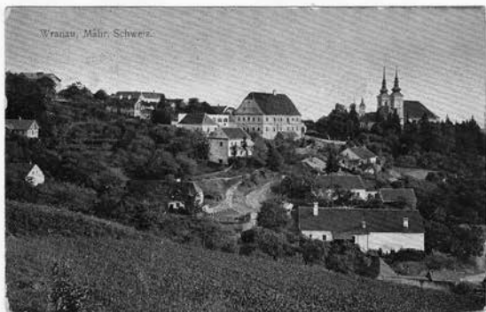
Takto vypadal Vranov v roce 1911. Horizontu vévodí vedle kostelních věží i objemná budova tehdejšího hotelu Skřivánek, dnešní "desítka", kde se scházeli členové Moravana.

Je fér připomenout si, že v době, kdy vranovský spolek vznikl, byla síla československých pěveckých spolků v celé monarchii ve srovnání s jejich německou obdobou slaboučká. Německy komunikující spolky