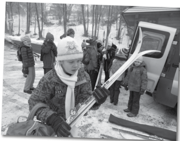
Zapsal Jindra Rychlý