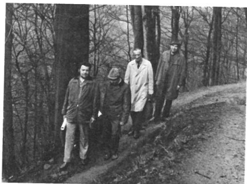
Klasický obrázek z cesty