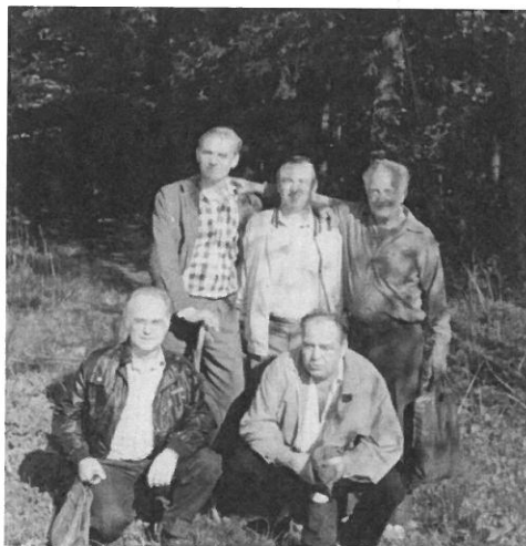
Stará cesta 1190