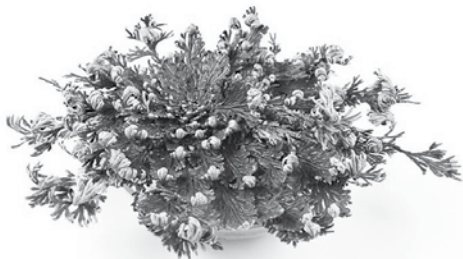
růže z Jericha

Výmluvně o tom svědčí zápisy kronikáře Metoděje Drexlera z roku 1947, kdy střední Evropu postihlo zničující sucho.