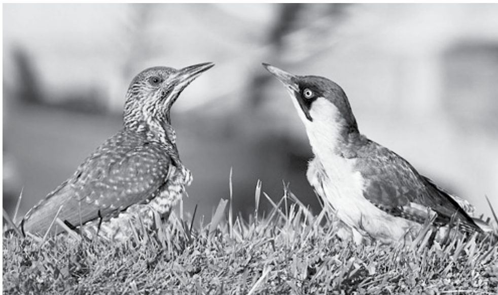
žluna zelená sameček a samička

starých časů řídily krátkodobé hospodářské plány vranovských rolníků. „Před východem slunce slabé červánky – pěkný den se slibuje. Jsou-li však větší a růžové, značí vítr. Jsou-li barvy cihlové, bude jistě ve dne pršet. Též zajde-li slunce po vyjití za mrak – prší ten den. Je-li ráno dusno, přijde bouře,“ zaznamenal Drexler letité zkušenosti své a svých předchůdců. Těm se ani nesnilo o dnes běžně dostupných on-line informacích z dešťových radarů či o numerickém modelu Aladin, přesto byli schopni leccos podstatného zachytit. „Zapadá-li slunce do mraků, je to znamení blížícího se deště. Jasně-li slunce zapadá, druhý den bude pěkně; je-li však na východě při tom žlutokrémová neb tmavá stěna, do rána přijde lijavec. Západ slunce při ohnivé záři, druhý den bude škaredě. Je-li tato zář cihlové barvy a velkého rozsahu neb nabude-li celý kraj širokožlutavé neb zelenožlutavé bar-