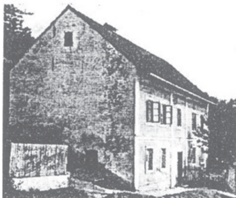
Takto vypadala budova původní budovy vranovského pivovaru v čp. 61 v době, kdy začínala druhá světová válka.