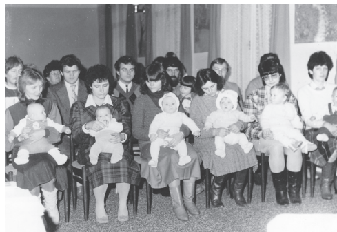
Vranovské vítání občánků v roce 1987

Vítání občánků se už nějakou dobu vrací do života. Jeho forma zůstává víceméně stejná – svátečně vystrojené mladé rodiny navštíví radnici, noví občánkové jsou uvítáni ceremoniářem, rodiče se podepíší do pamětní knihy, poté je předán rodi-