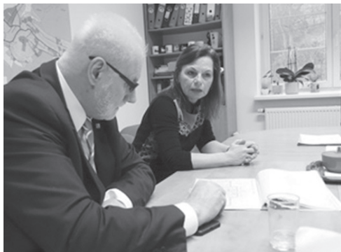
Hejtmán Bohumil Šimek se starostkou Kateřinou Jetelinovou.

Hejtmán Šimek ve Vranově zakončil svou pracovní návštěvu obcí na Brněnsku. Předtím stihl absolvovat návštěvu také v Ochozi u Brna a v Bílovicích nad Svitavou.