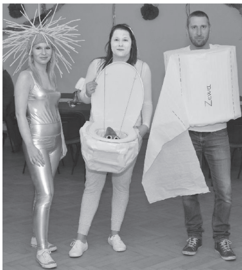
Vítězná maska ostatkové zábavy, originálně ztvárněná trojice sady záchodového vybavení.

Naše činnost v letošním roce začala hodnocením uplynulého roku na valné hromadě sboru. Hodnotili jsme loňský rok, ale zároveň jsme sestavovali plán činnosti na rok letošní. Valná hromada se konala 13. ledna v sále obecního domu a navštívili ji i zástupci Okresního sdružení hasičů Čech, Moravy a Slezska. Do plánu činnosti jsme zařadili akce kulturní, ale také sportovní a pracovní. Z kulturních akcí např. masopustní průvod, ostatkovou zábavu, pálení čarodějnic, hody. Sportovní akce např. prvomájový fotbálek, soutěže v hasičských dovednostech a podobně. Pracovní akce jsou například úklid chodníků po zimní údržbě, sběr železného šrotu, celoroční údržba a oprava techniky a zbrojnice. Hlavním úkolem pro letošní rok je uspořádání oslav 105. výročí založení sboru.