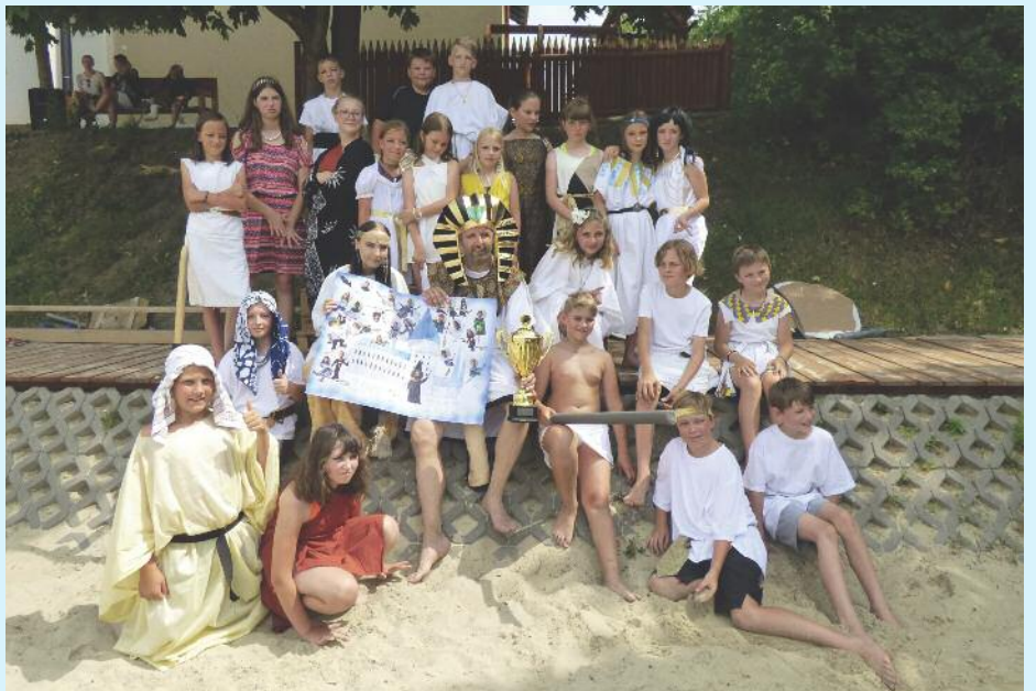
Loučení s páťáky.