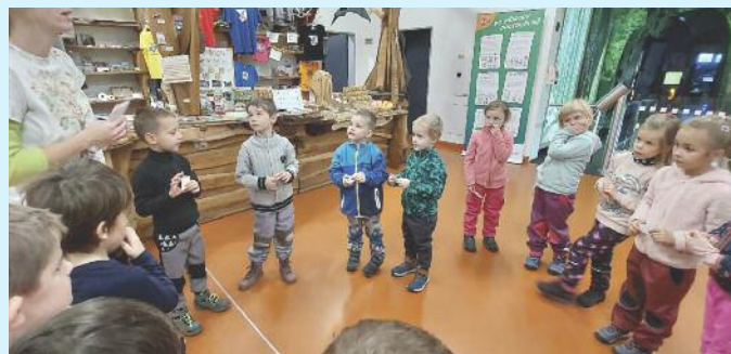
Dům přírody Moravský kras

ského krasu, na procházce ve vranovském lese za "Nekonečnem" pořádanou lesní pedagožkou z „Lesy Kuřim“.