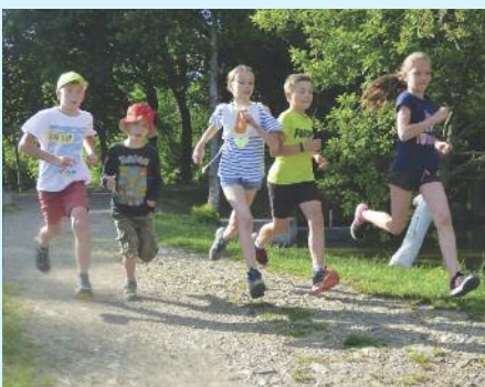
Fota ze ŠvP Jedovnice, mladší žáci, 19.–24. června.