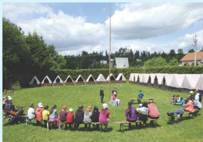
Fota ze ŠvP Jedovnice, starší žáci, 12.–17. června.

Děkujeme všem rodičům, kteří se podíleli na spolupráci či přípravě akce.