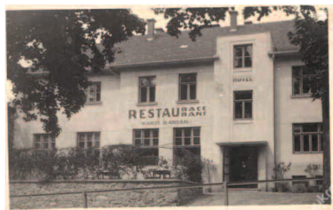
Hotel Barták z první republiky, dnes Hotel Vranov.