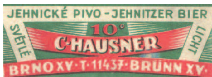
Reklama na jehnické pivo.