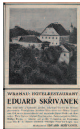
Reklama hotel Skřivánek.

Vraťme se zpátky do Vranova. Podle zprávy z roku 1733 bylo v období poutí vyšenkováno 42 beček piva, což pánům zajistilo 734 zlatých. Klášter patrně zákazů nedbal a stále vařil pivo vlastní, nebo je dovážel ze svých vesnic, které mu patřily. Vlastnil totiž