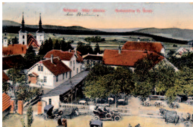
Vedle školy stávala oblíbená zahradní restaurace u Šebků.

co kdo chce, objednávku pak odevzdal v kanceláři pivovaru a v sobotu se do hospod naváželo.