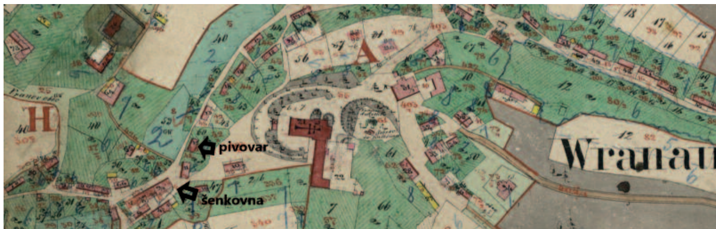
Pivovar a šenkovna na Vranově, okolo roku 1870.

časně dostával potraviny v hodnotě dalších 170 zlatých ročně. Vycházelo mu to na dva bochníky chleba denně, k tomu dva mázy, čili zhruba dva litry piva denně plus kaši. Ročně měl dále nárok na 30 kilo syra, tři misky soli, 12 kilo sádla, dávku žita a pšenice a další potraviny. Navrch svíčky a palivové dříví. Vedle bydlel bednář, ten měl nárok na 15 zlatek ročního platu a podobnou, i když menší dávku naturálií. Známe dokonce i jména těchto dvou pivovarníků, sládek se jmenoval František Zvěřina a bednář Matěj Ondřej.