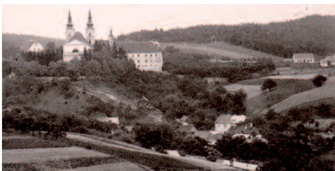
Nejstarší dochovaná fotka Vranova, rok 1880.